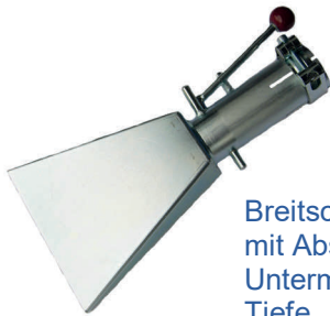
Breitschlitzdüse 10 x 155 mm, mit Absperrklappe für das Untermörteln bis ca. 120 mm Tiefe