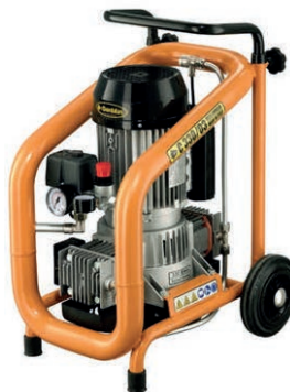
Kompressor mit mind. 2 kW Antriebsleistung