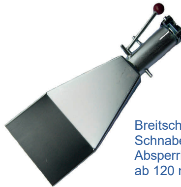
Breitschlitzdüse 8 x 155 mm mit Schnabel 110 x 9,5 mm und Absperrklappe für das Untermörteln ab 120 mm bis über 400 mm Tiefe