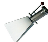
Breitschlitzdüse DN 34