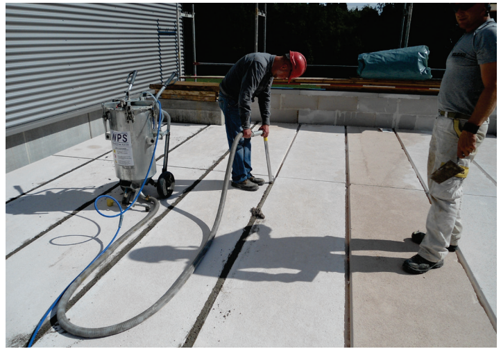
Ausmörteln von Deckenplatten-Fugen