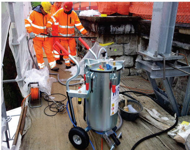
Mörtelinjektion für Fels- oder Maueranker