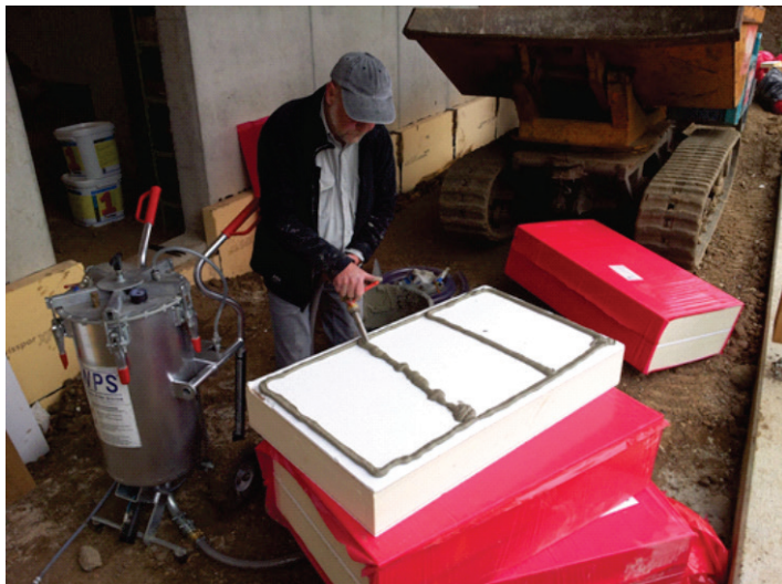
Mörtelkleber bei Dämmplatten auftragen