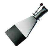
Breitschlitzdüse DN 34 mit Schnabel