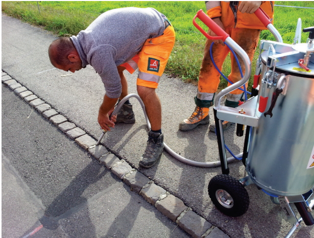
Fugen von Bordsteinen